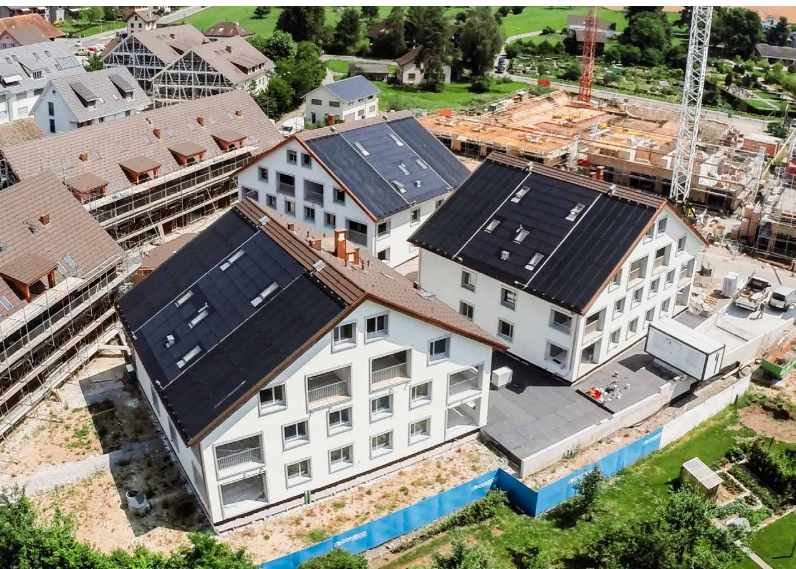
Luftaufnahme der drei Solarhäuser der Wohnbaugenossenschaft «maettmi50plus»; die Überbauung weist 23 Wohnungen auf.

Die Genosschafter von «maettmi50plus» in Mettmenstetten (ZH) sind fast alle Rentner, und sie setzen auf Nachhaltigkeit: Die Wärme, die die Erdsonden dem Boden entziehen, wird über Sonnenkollektoren zurückgeführt.